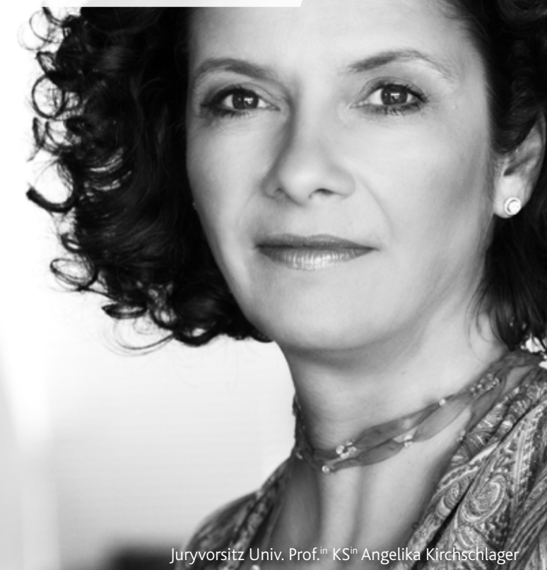
Juryvorsitz Univ. Prof. in KS in Angelika Kirchschrager

REGION Zum Haydn NIEDERÖSTERREICH COMPETITION