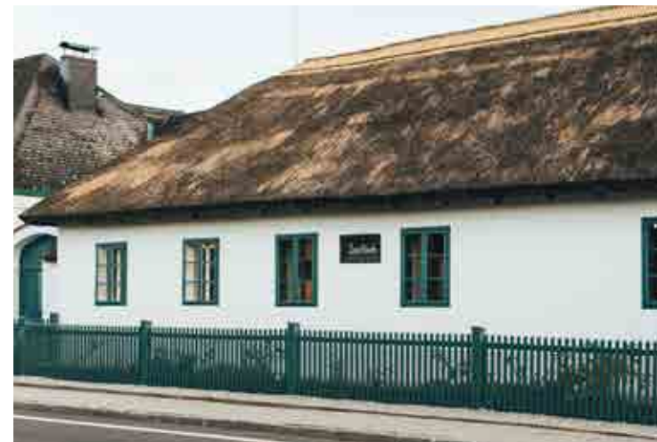
Haydn Geburtshaus Rohrau

Die Werkauswahl liegt in der künstlerischen Verantwortung der TeilnehmerInnen. Die Werke sind auswendig und in der Originalsprache vorzutragen. Mit der Anmeldung wird von den TeilnehmerInnen eine verbindliche Repertoireliste eingereicht. Nachträgliche Änderungen sind nicht möglich.