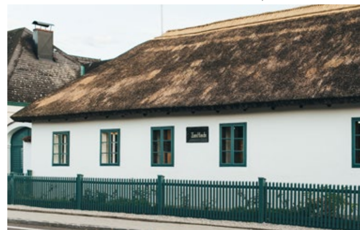
Haydn Geburtshaus Rohrau

Die Werkauswahl liegt in der künstlerischen Verantwortung der TeilnehmerInnen. Die Werke sind auswendig und in der Originalsprache vorzutragen. Mit der Anmeldung wird von den TeilnehmerInnen eine verbindliche Repertoireliste eingereicht. Nachträgliche Änderungen sind nicht möglich.