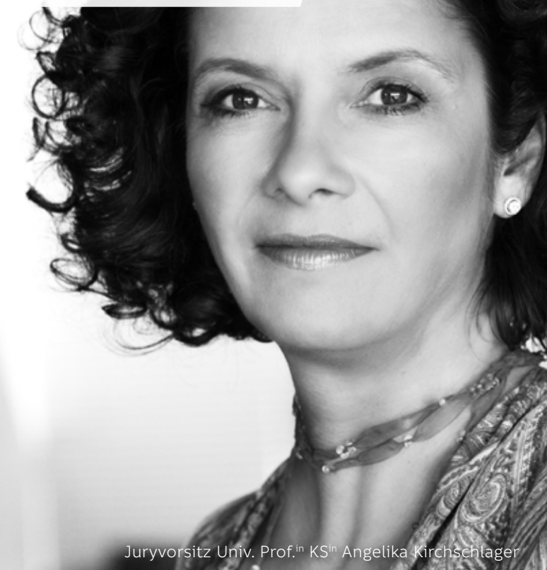
Juryvorsitz Univ. Prof. in KS in Angelika Kirchschlager

REGION Zum Haydn NIEDERÖSTERREICH COMPETITION