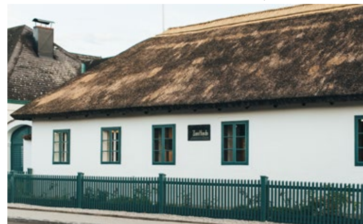
Haydn Geburtshaus Rohrau

Die Werkauswahl liegt in der künstlerischen Verantwortung der TeilnehmerInnen. Die Werke sind auswendig und in der Originalsprache vorzutragen. Mit der Anmeldung wird von den TeilnehmerInnen eine verbindliche Repertoireliste eingereicht. Nachträgliche Änderungen sind nicht möglich.