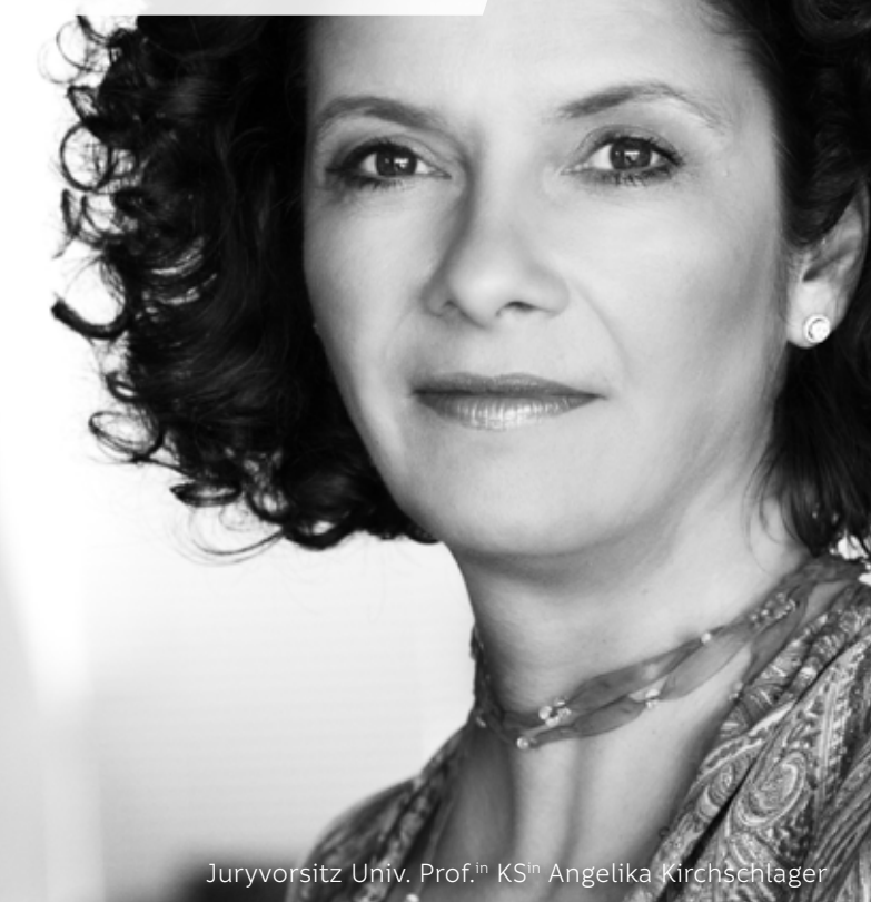
Juryvorsitz Univ. Prof. in KS in Angelika Kirchschlager

REGION Zum Haydn NIEDERÖSTERREICH COMPETITION