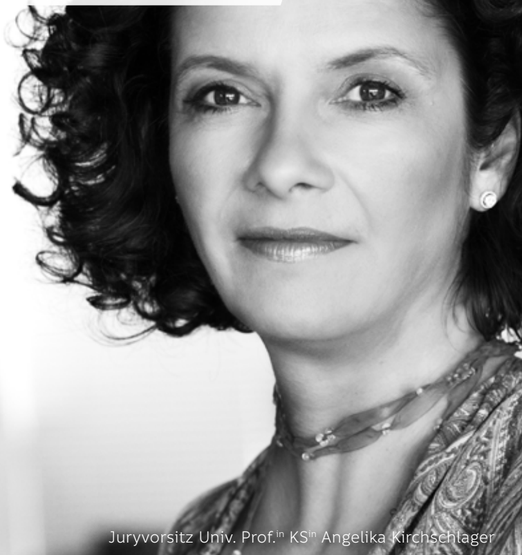
Juryvorsitz Univ. Prof. in KS in Angelika Kirchschlager

REGION Zum Haydn NIEDERÖSTERREICH COMPETITION