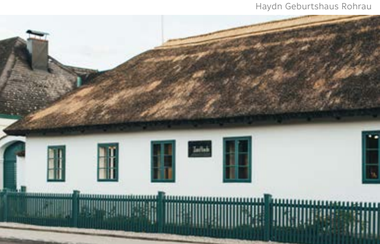
Haydn Geburtshaus Rohrau

Die Werkauswahl liegt in der künstlerischen Verantwortung der TeilnehmerInnen. Die Werke sind auswendig und in der Originalsprache vorzutragen. Mit der Anmeldung wird von den TeilnehmerInnen eine verbindliche Repertoireliste eingereicht. Nachträgliche Änderungen sind nicht möglich.