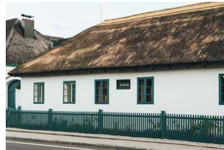
Haydn Geburtshaus Rohrau

Die Werkauswahl liegt in der künstlerischen Verantwortung der TeilnehmerInnen. Die Werke sind auswendig und in der Originalsprache vorzutragen. Mit der Anmeldung wird von den TeilnehmerInnen eine verbindliche Repertoireliste eingereicht. Nachträgliche Änderungen sind nicht möglich.