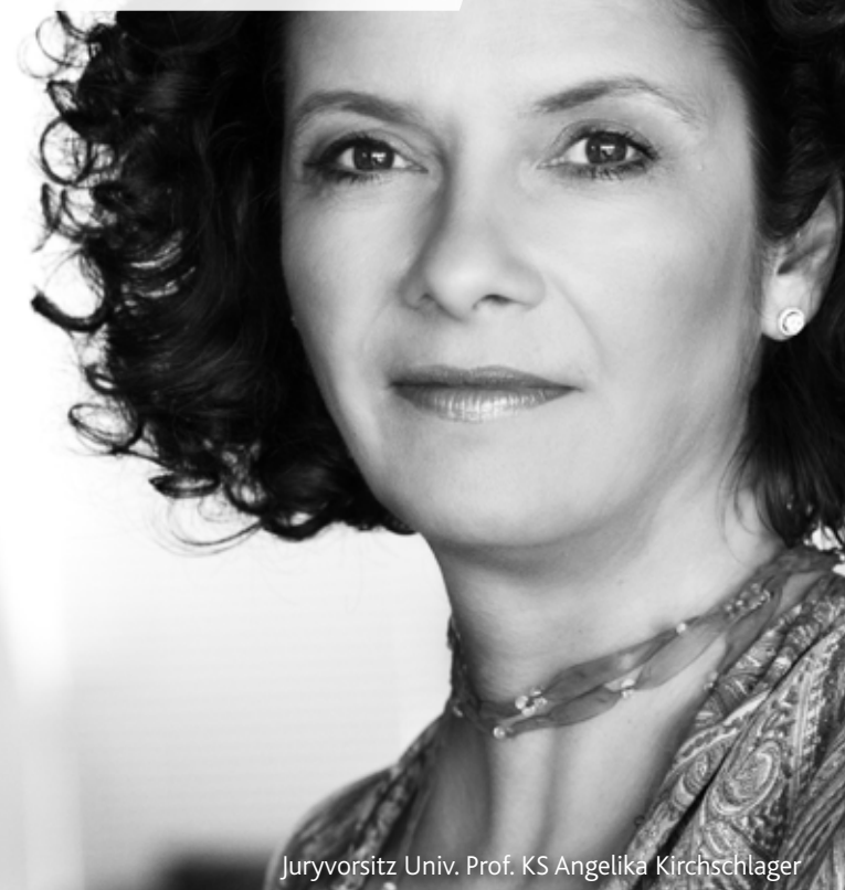
Juryvorsitz Univ. Prof. KS Angelika Kirchschrager

REGION Zum Haydn NIEDERÖSTERREICH COMPETITION