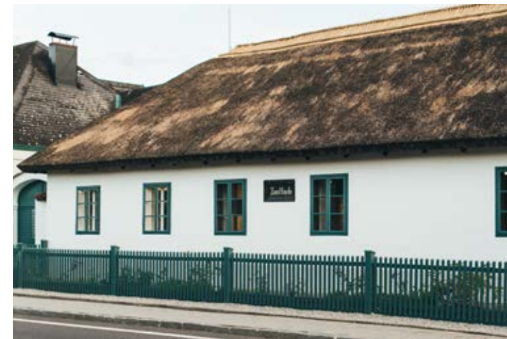
Haydn Geburtshaus Rohrau

Die Werkauswahl liegt in der künstlerischen Verantwortung der TeilnehmerInnen. Die Werke sind auswendig und in der Originalsprache vorzutragen. Mit der Anmeldung wird von den TeilnehmerInnen eine verbindliche Repertoireliste eingereicht. Nachträgliche Änderungen sind nicht möglich.